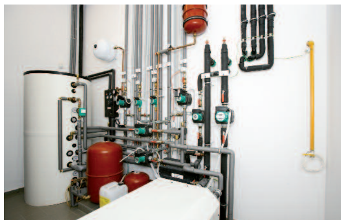
Kotolňa s tepelným čerpadlom, zásobníkom teplej úžitkovej vody, prívodom zo solárnych panelov. Všetko pod dohľadom riadiaceho systému Crestron.

zií. Pomocou žalúzií vieme v lete zabrániť prehriatiu priestorov, a tým šetriť energiu potrebnú na chladenie. Na základe údajov z meteorologickej stanice vieme pomocou riadiaceho systému Crestron presnú